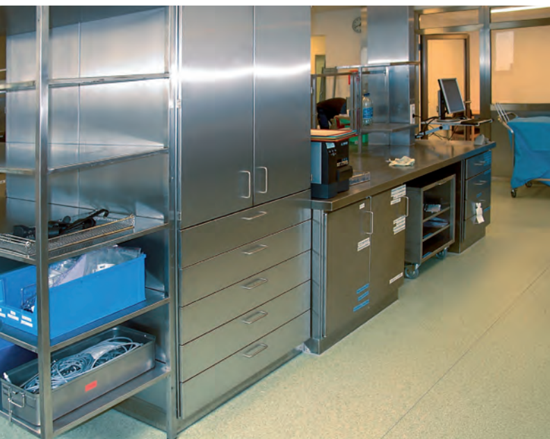
▲ Packtisanlage mit Aufsatzelement und Edelstahl-Regal