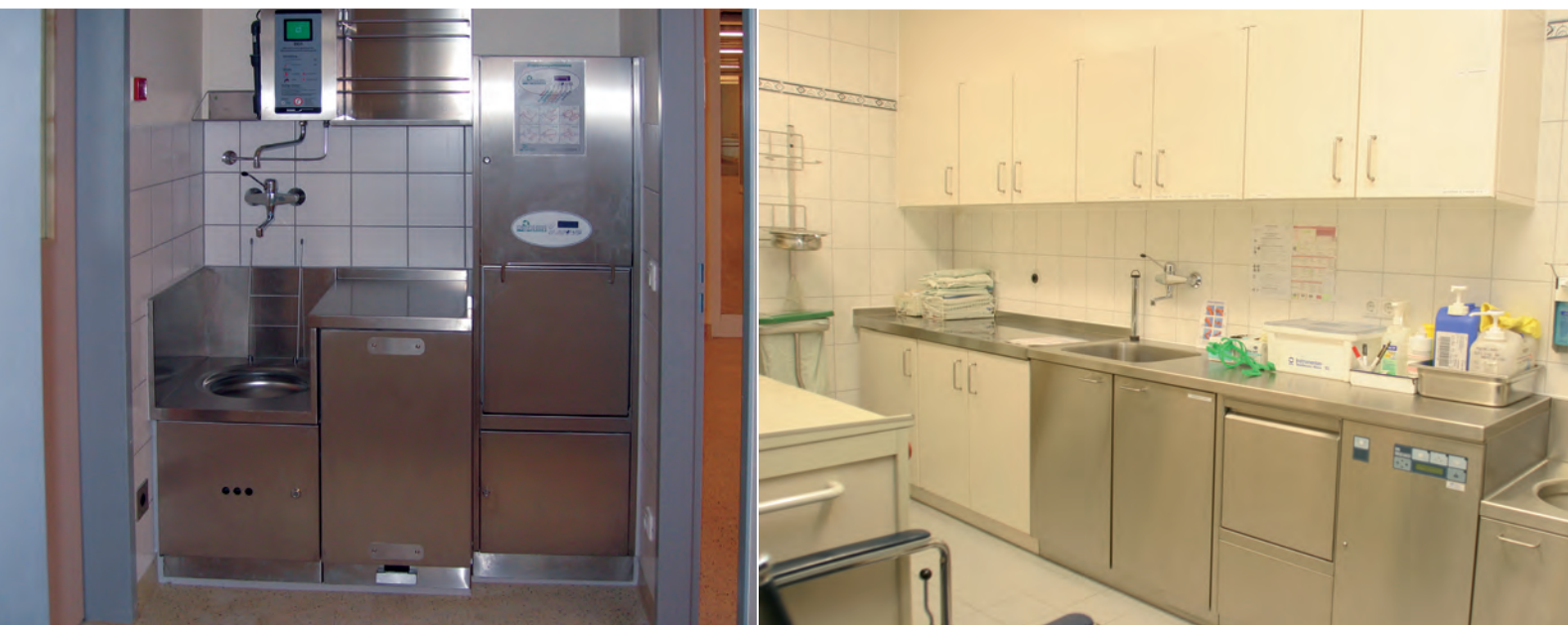
▲ Pflegekombinationen mit integrierten Reinigungs-/Desinfektionsautomaten, Hospitalausgüssen, Abfallauszugsschrank, Desinfektionsmittelzumischgeräten und Lagereinheiten für Urinflaschen und Steckbecken