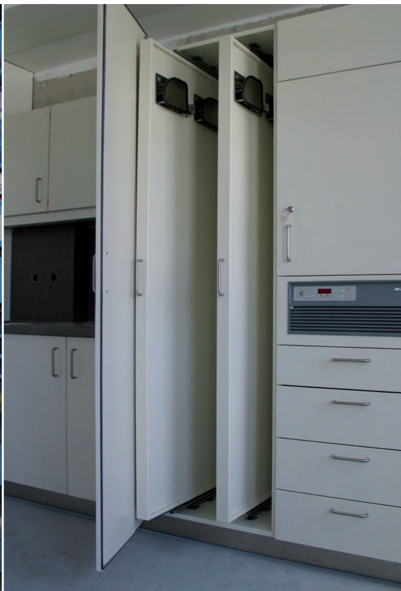
▲ Schrankkombination mit Medikamentenkühlschrank und Lagereinheit für Endoskope (mit Auszugswänden)