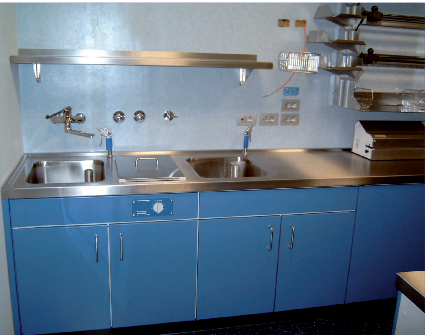
▲ Reinigungstischanlage mit Ultraschallbecken