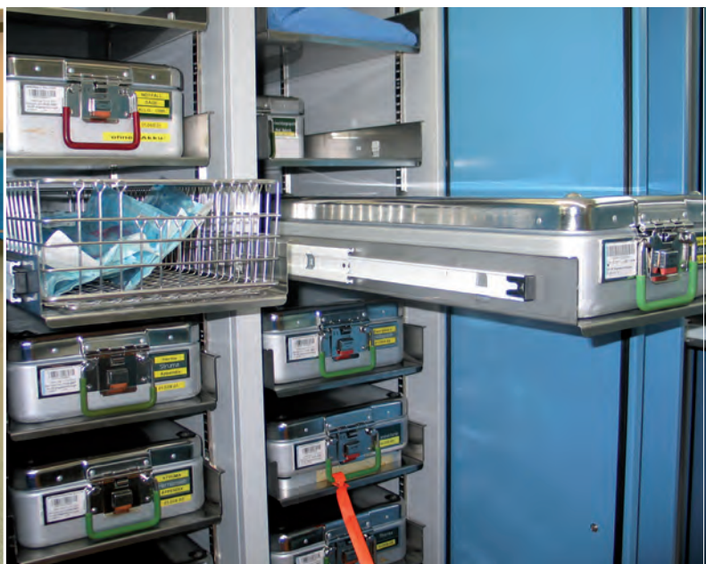
▲ Lagerschrank für Ste-Container in der Sterilgutversorgung