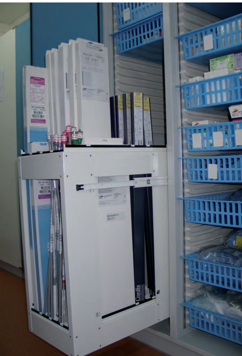
▲ ISO-Hochschrank mit Modulausstattung und Auszug zur Katheterlagerung